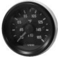
#12-RTA12 ..... ¥22,300 0~8000RPM - 2"

※この回転計は、RANS社の純正計器として発売されています。裏側の切替スイッチにより、2サイクルエンジン(ポイント及びD/IGNITION)及び4サイクルエンジン(ROTAX 912)等、2気筒・3気筒・4気筒HIRTH・ROTAX 問わず全てのエンジンに使用出来ます。