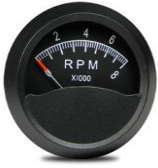
#81-01615 ..... ¥16,500 0~8000RPM - 2"