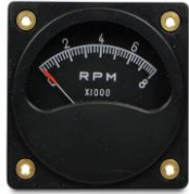
#81-00816 ..... ¥17,900 0~8000RPM - 2-1/4"