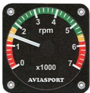
ROTAX912-914 用 #02-966-405 ..... ¥32,600 0~7000RPM - 2-1/4"