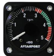
(0~500RPMレンジ) #81-05378 ..... ¥27,950