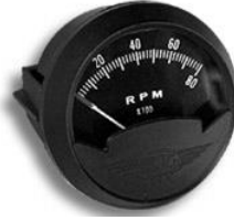
#81-1303 ..... ¥19,800 0~8000RPM - 3"