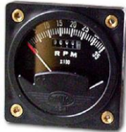
#81-03980 ..... ¥26,300 0~8000RPM - 2-1/4" (WESTACH製)