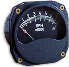
#81-00817 ..... ¥21,300 0~8000RPM - 3-1/8"