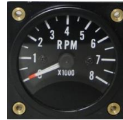
フルスケールゲージ(12V要) #81-WS2ATH8A1 ..... ¥35,600 0~8000RPM - 2-1/4"