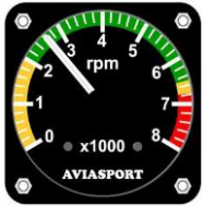
ROTAX用 #02-966-405 ..... ¥28,900 0~8000RPM - 2-1/4"