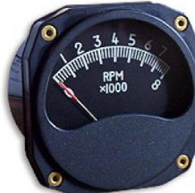
#81-05836 ..... ¥23,800 0~8000RPM - 3-1/8"