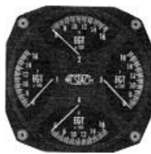
サイズ 3-1/8" EGT/EGT/EGT/EGT(EGTX4) #81-QD713 ..... ¥49,300