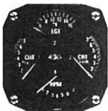
サイズ 3-1/8" RPM/CHT/CHT/EGT #81-QD716 ..... ¥