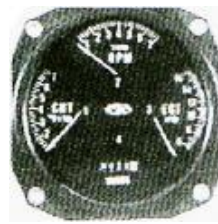
サイズ 3-1/8" RPM/CHT/EGT/アワーメーター #81-QD714 ..... ¥