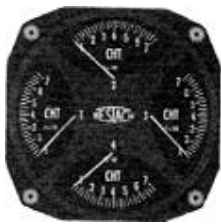
サイズ 3-1/8" CHT/CHT/CHT/CHT(CHTX4) #81-QD712 ..... ¥48,700