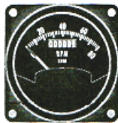
サイズ 2-1/4" #81-1225 ..... ¥26,900 #81-5113 ..... ¥28,600 (4サイクル(912)用)