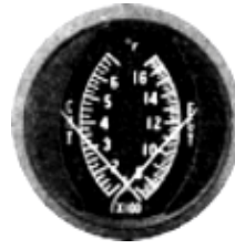
CHT/EGT-3" #81-1323 ..... ¥18,900