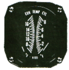
CHT/EGT 3-1/8" #81-1324 ..... ¥19,800

※CHTとEGTが1つになっている計器です。センサー関係は含まれておりませんので必要なタイプを別途お求め下さい。