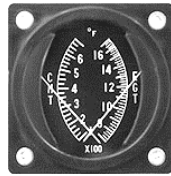
CHT/EGT 2-1/4" #81-1322 ..... ¥14,400