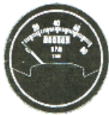
サイズ 2" #81-1224 ..... ¥25,600 #81-5112 ..... ¥27,300 (4サイクル(912)用)