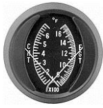
CHT/EGT-2" #81-1321 ..... ¥12,480