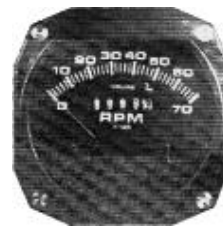
サイズ 3-1/8" #81-1226 ..... ¥29,800

※0~8000RPM及び0~9999時間 までの回転計とアワーメーターが セットになっている計器です。 2サイクル用(ポイント及び D/IGNITION)と4サイクル (Rotax 912)用がございますので 用途に合わせてお選び下さい。