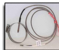
EGT Clamp Type