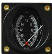
EGT/EGT 2-1/4" (700~1700°F) #81-00487 ..... ¥38,430