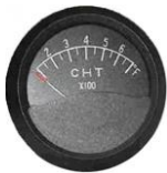
CHT 2" (100~700°F) #81-01412 ..... ¥16,380