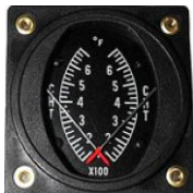
CHT/CHT 2-1/4" (100~700°F) #81-03960 ..... ¥36,980