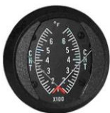
CHT/CHT 2" (100~700°F) #81-00486 ..... ¥32,280