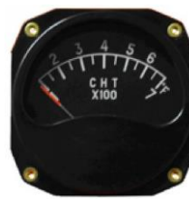
CHT 3-1/8" (100~700°F) #81-02283 ..... ¥29,120