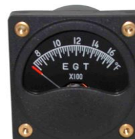
EGT 3-1/8" (700~1700°F) #81-02289 ..... ¥24,930