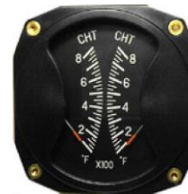
CHT/CHT 3-1/8" (100~700°F) #81-02280 ..... ¥38,600