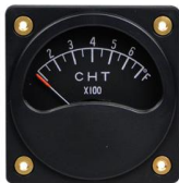
CHT 2-1/4" (100~700°F) #81-03959 ..... ¥14,430