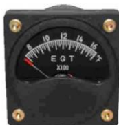
EGT 2-1/4" (700~1700°F) #81-01457 ..... ¥18,570