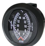
EGT/EGT 2" (700~1700°F) #81-01453 ..... ¥26,910