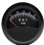
EGT 2" (700~1700°F) #81-01449 ..... ¥16,540