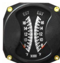
EGT/EGT 3-1/8" (700~1700°F) #81-02290 ..... ¥39,800